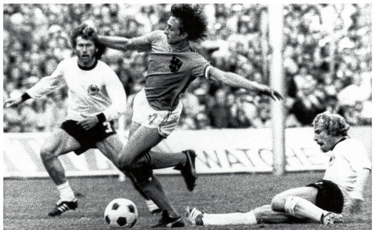
Voller Einsatz: Paul Breitner (links) beim WM-Finalspiel Deutschland - Niederlande 1974, rechts Bert Vogts.

Der 48-fache Fußballnationalist war ein begnadeter Linksverteidiger und maß-